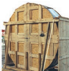
■ Sistema portacavi completo con imballo idoneo al trasporto