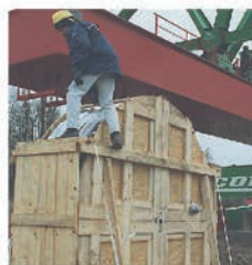
■ Montaggio di un sistema portacavi completo