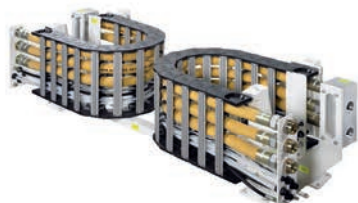
■ Catena portacavi in poliammide completa, confezionata con cavi, connettori e lamiera di supporto