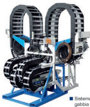
■ Sistema completo con gabbia per il trasporto

Cavi, connettori così come altri componenti disponibili a magazzino