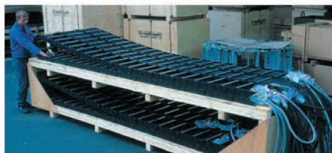
■ Catena portacavi in poliammide, cablata, confezionata, imballata e pronta per il montaggio

Noi gestiamo la programmazione, la progettazione così come l'approvvigionamento di tutti i componenti per il Vostro sistema portacavi completo.